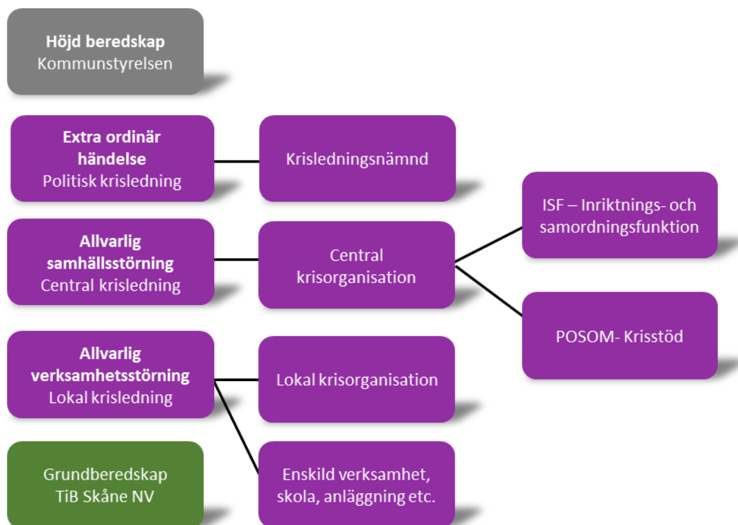
Figur 1. kommunens krisorganisation

*Fristående resurs som kan verka själv oberoende av central krisledning