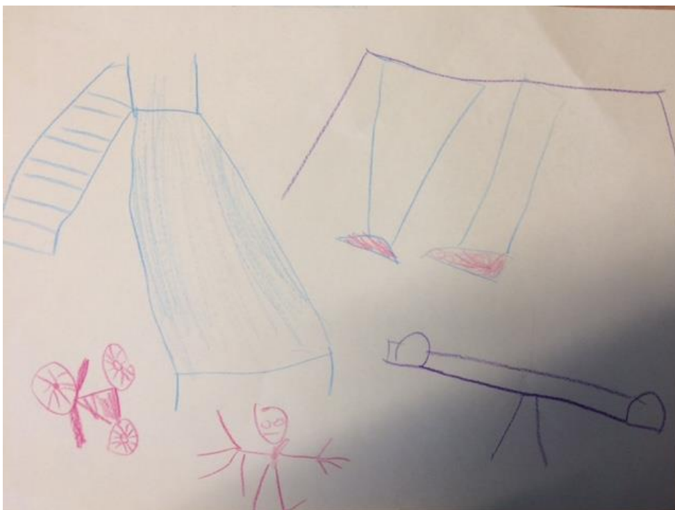
Ett barns bild av en hälsoförskola.

Resultatet av workshopen redovisas i sin helhet i dokumentet Workshop 2 Hälsoförskolan 16 mars 2017 (sammanställningen har även varit tillgänglig för allmänheten på biblioteket), nedan följer några tydliga exempel: