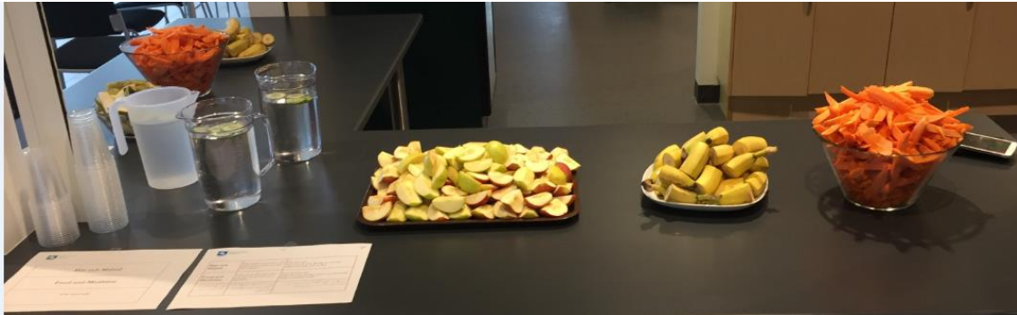
Frukt och grönt.

Det fanns en station där barnen kunde utöva fysisk aktivitet, det bjöds på grönsaksstavar och framför allt gavs besökarna en möjlighet att få information om Hälsöförskolan och öppna upp en dialog om hur man kan arbeta för att öka barns hälsa. De två arkitekter som engagerats i projektet var på plats och presenterade sina konceptförslag för besökarna. Studenter från Malmö högskola visade upp resultatet av fem st. designidéer bl.a. en pulsmätare för barn samt en interaktiv vägg.